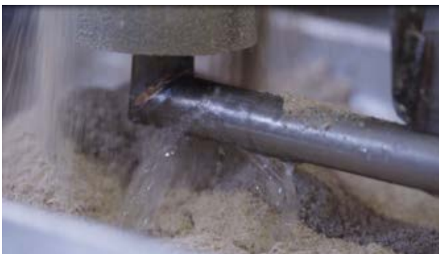
Vandet og foderet blandes først i bunden af truget.