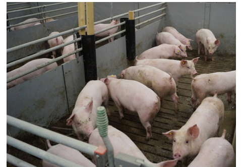
Rodemateriale til slagtesvin 650x4 mm uden træstokke, ekskl. bolte og skruer Varenr. 4960705