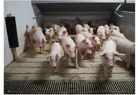
Rodemateriale til smågrise 500x4 mm uden træstokke, ekskl. bolte og skruer Varenr. 4960704